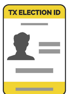
Certificado de Identificación Electoral de Texas*