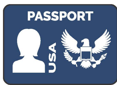
Pasaporte de EE. UU.* (Libro o Tarjeta)