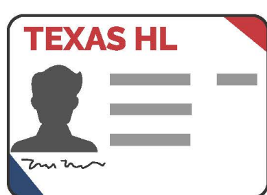
Licencia para Portar Armas de Fuego en Texas*