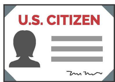
Certificado de Ciudadanía de EE. UU. con Fotografía