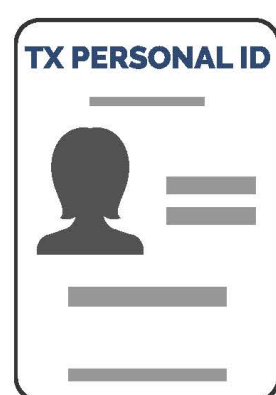
Tarjeta de Identificación Personal de Texas*